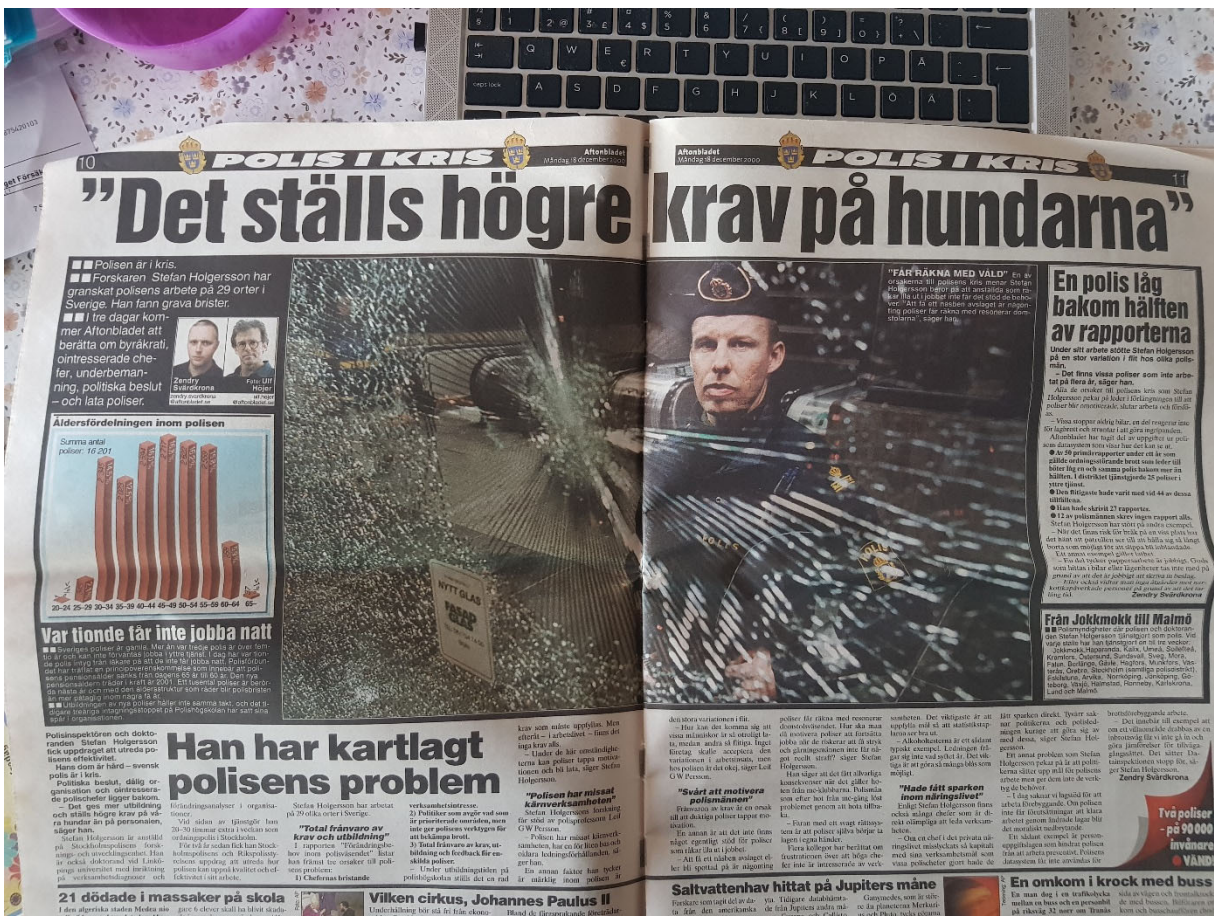
(Artikeln kommer presenteras nedan)